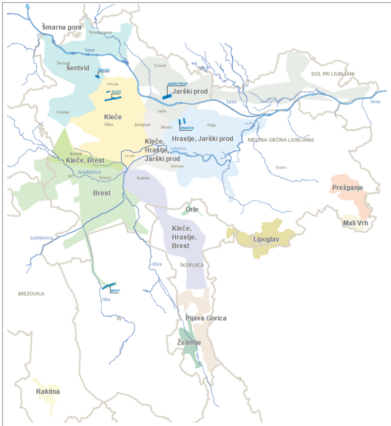
Slika 2. Oskrbovalna območja centralnega in lokalnih vodovodnih sistemov v Ljubljani in okolici v upravljanju JP VODOVOD-KANALIZACIJA v prostoru